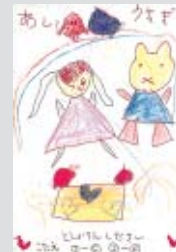
及川 愛ちゃん (中央区・5歳)

「津」 写しに「津」を出し、出逢いに喜びを感じ 今日も生きていく... 私は今日も涙の心に濡れられ 私だけの夢を作って... いつか私だけの夢は誰かを助ける。 別れて出逢い... その為に「津」を出し、 時は重なり、思いが作られて いくのだから... 1、2、3、4、5、6、7、8、9、10、11、12、13、14、15、16、17、18、19、20、21、22、23、24、25、26、27、28、29、30、31、32、33、34、35、36、37、38、39、40、41、42、43、44、45、46、47、48、49、50、51、52、53、54、55、56、57、58、59、60、61、62、63、64、65、66、67、68、69、70、71、72、73、74、75、76、77、78、79、80、81、82、83、84、85、86、87、88、89、90、91、92、93、94、95、96、97、98、99、100