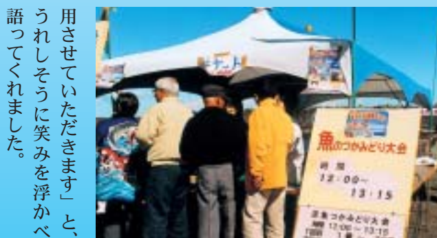
海産まつりで活躍したテント（三張購入）