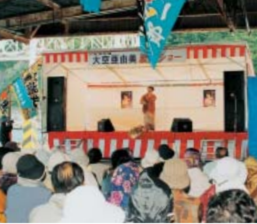
ふだいまるごと海産まつりにも 使用された組み立て式ステージ

財団法人自治総合センターの宝くじ普及広報事業（コミュニティ助成事業）から二百五十万円の助成を受け、イベント用品を購入しました。備品の購入は、組み立て式ステージ一基、イベントテント三張りとした。