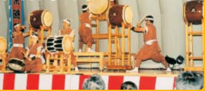
10年の成果を響かせるふだい荒磯太鼓の会員たち (11/23 村社会体育館)