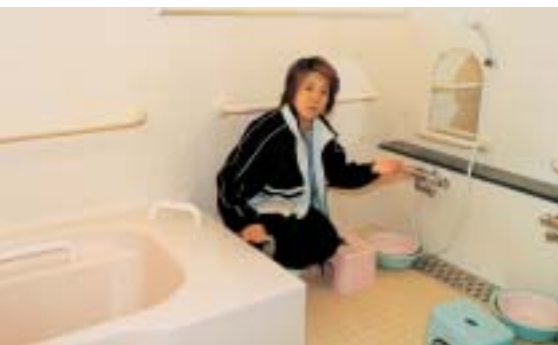
共同浴場、2人が一度に入れます