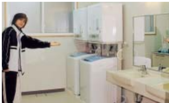
洗面所と洗濯室。洗濯機は全自動で利用者が自由に使えます