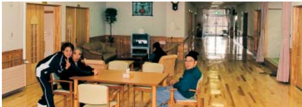
食堂・交流ホール。右側の廊下の奥が玄関になります