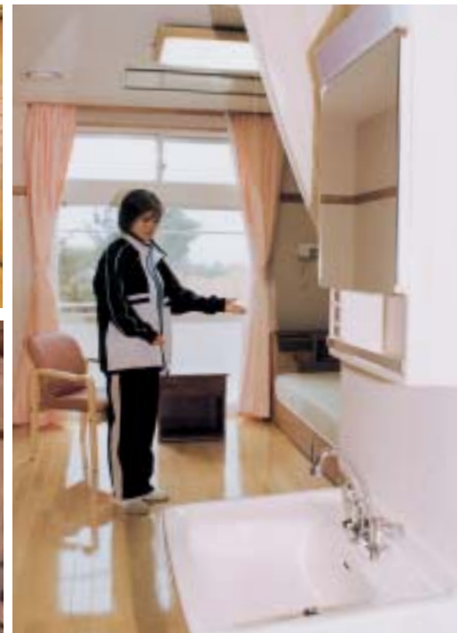
ここが8畳の広さのベッド付き洋室です