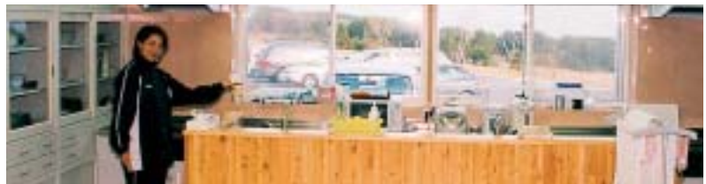
台所では利用者と介護員が一緒になって食事を作ります