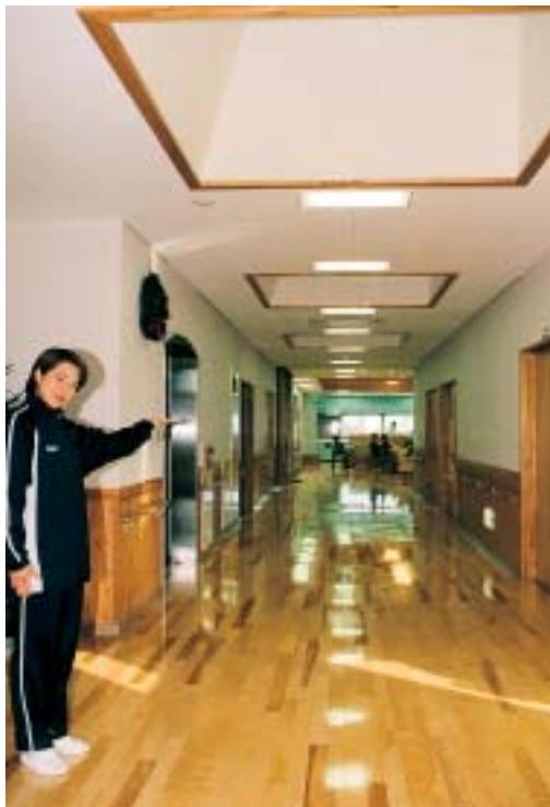
玄関を入って右側が居室になります