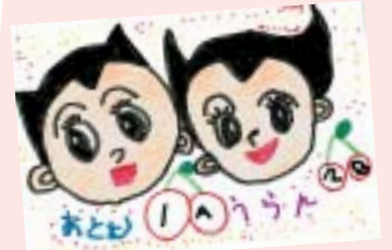
熊谷 久美恵 (盛岡市・4歳)