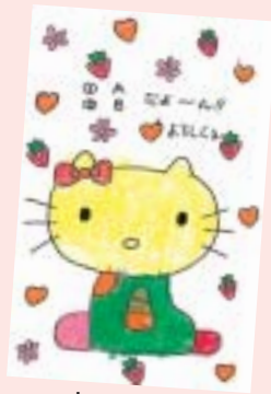
赤坂 春香 (白井・6歳)