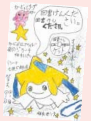
畑 俊輔 (堀内・10歳)