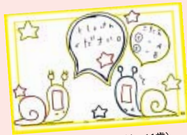
新屋 桃子 (滝沢村・11歳)