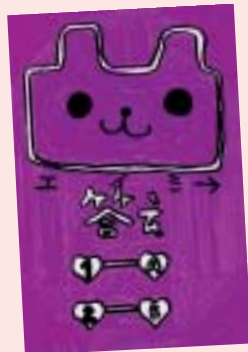
熊谷 久利実 (盛岡市・10歳)