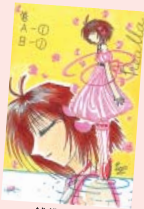
銭袋 千春 (中央区・18歳)