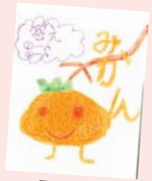
下坪 夏南 (黒崎・8歳)