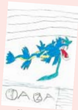
駒木 李音 (黒崎・7歳)