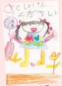
赤坂 春香 (白井・6歳)