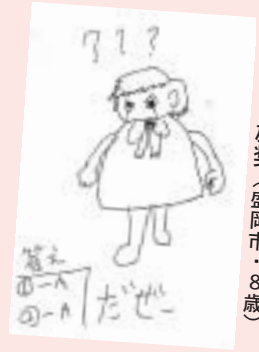
島山 雄奨 (盛岡市・8歳)