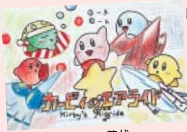
柳沢 華代 (中央区・13歳)