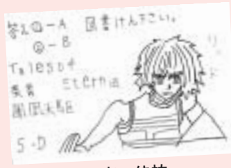
片座 佳祐 (黒崎・11歳)