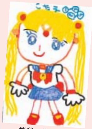
熊谷 久美恵 (盛岡市・4歳)