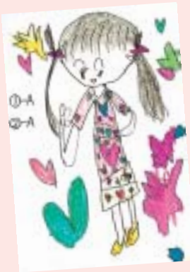
銭袋 あかね (上区・4歳)