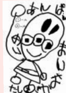
松家 芽 (堀内・4歳)