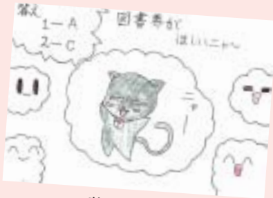
落合 涼香 (中央区・10歳)