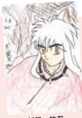
新屋 祐莉 (中央区・10歳)