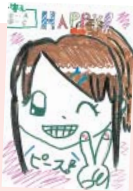
島山 彩愛 (盛岡市・10歳)