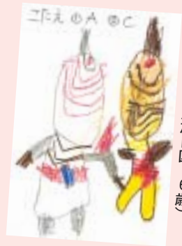
日沼 春稀 (旭日区・6歳)