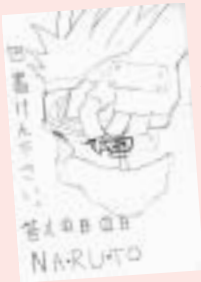
新屋 吉将くん (黒崎・12歳)