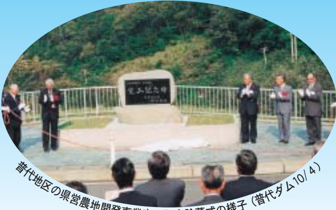
普代地区の県営農地開発事業完工記念除幕式の様子 (普代ダム10/4)