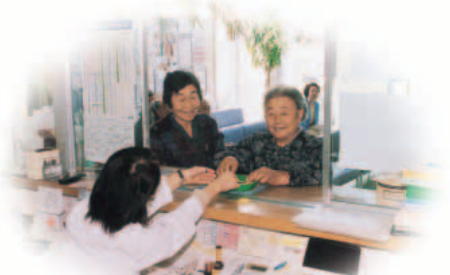
村医科診療所の窓口で受給者証を提示する高齢者たち