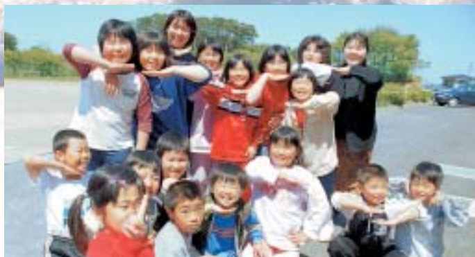
笑顔で未来を開きましょう

行政では一般的に家庭で言う収入は歳入、支出は歳出とっています。表の中に出てくる基金は貯金に当たり、村債というのは借金に当たります。お金が足りなくなると、この基金を取り崩したりしながら村の財政を運営していきます。皆さんが急にお金が必要になったとき貯金を下ろして使うのと同じです。 特別会計は一般会計とは区別して経理した方が分かりやすい