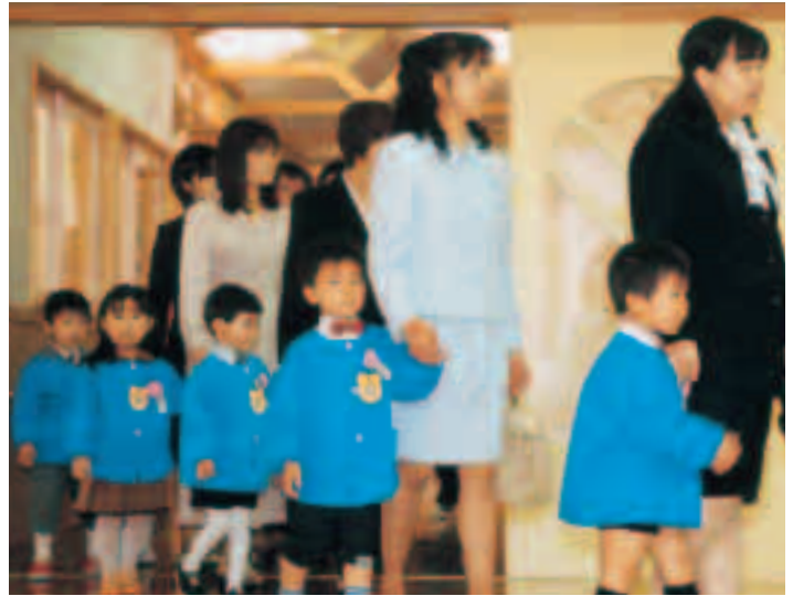
幼児教育の充実（普代児童館4/10入園式で）