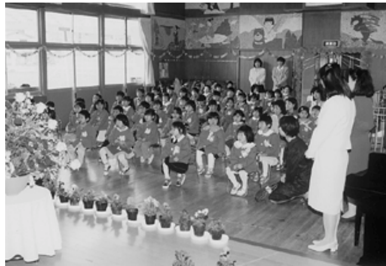
安心して子育てができるよう少子化対策などに取り組みます（普代児童館入園式）